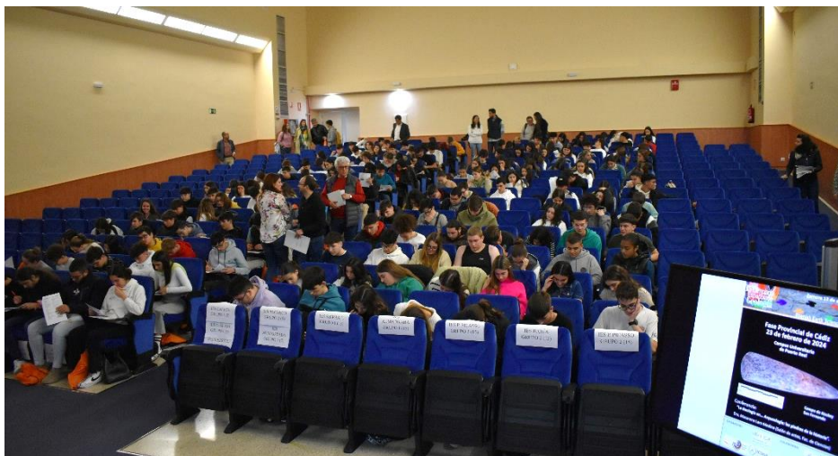
Alumnos en el examen teórico individual.

A continuación, se desarrolló la prueba teórica individual y tras el desayuno, los alumnos pasaron a realizar los dos ejercicios prácticos en equipos. Los ejercicios prácticos consistieron en el reconocimiento de visu de rocas y minerales y dar respuesta a cuestiones a partir de la interpretación de un bloque diagrama.