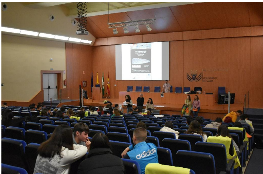
Pruebas por equipos: deducción de una historia geológica a partir de un bloque diagrama dado.