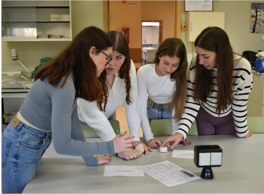
Pruebas por equipos: visu de minerales y rocas.